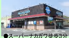
●スーパーナカガワ徒歩3分