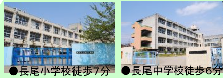
●長尾小学校徒歩7分 ●長尾中学校徒歩6分