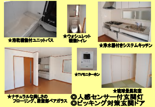
★浴槽乾燥機能付ユニットバス ★ウォッシュレット機能トイレ ★浄水器付システムキッチン ★TVモニターホン ★ナチュラな美しさのフローリング、居室部ペアガラス ★地球環境和室 ◎人感センサー付玄関灯 ◎ピッキング対策玄関ドア